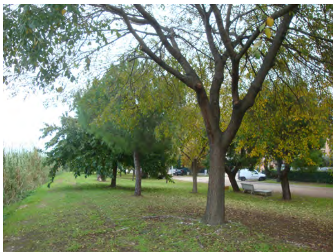
Vegetazione arborea dell'area a verde pubblico prossima all'argine destro