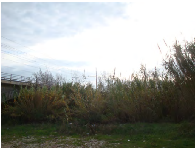
Argine prossimo al ponte ferroviario popolamenti a canna domestica con qualche salice arbustivo