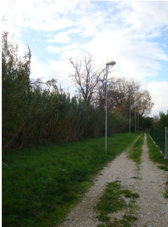
Robinie radicata al piede esterno dell'argine

- in sponda sinistra oltre alla canna domestica, che ricopre l'argine e discende in parte anche nell'alveo, si ha della robinia ( Robinia pseudoacacia ) disposta in piccoli gruppi e qualche pioppo nero isolato radicati in prossimità del piede esterno dell'argine;