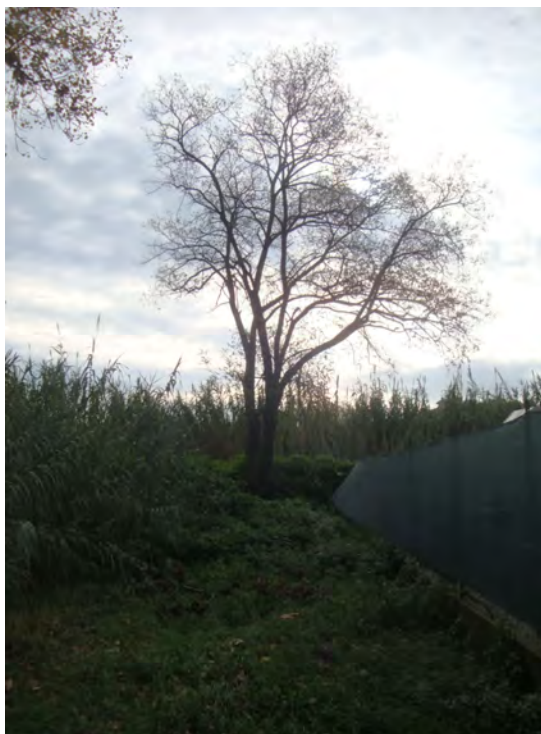
Robinia radicata al piede esterno dell'argine in prossimità del depuratore

- in sponda orografica destra l'argine è privo di vegetazione e quest'ultima è presente nell'alveo composta da canna domestica, alcuni salici e pioppi isolati