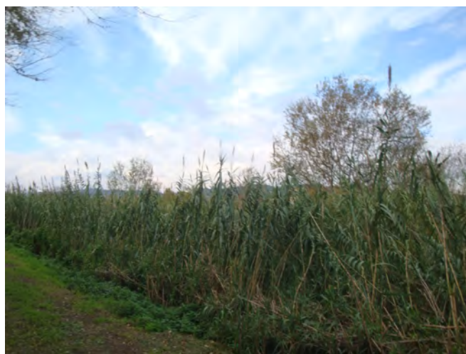
Popolamento di canna domestica con qualche salice arbustivo

arbustivi. A ridosso dell'argine, a sud, è presente una fascia di verde pubblico che si sviluppa parallelamente al fiume dove sono presenti delle alberature disposte in filari costituite da salici ( Salix spp.), pino d'aleppo ( Pinus halepensis ), gelso ( Morus platanifolia ), pioppo nero ( Populus nigra ), farnia ( Quercus robur f. fastigiata ).