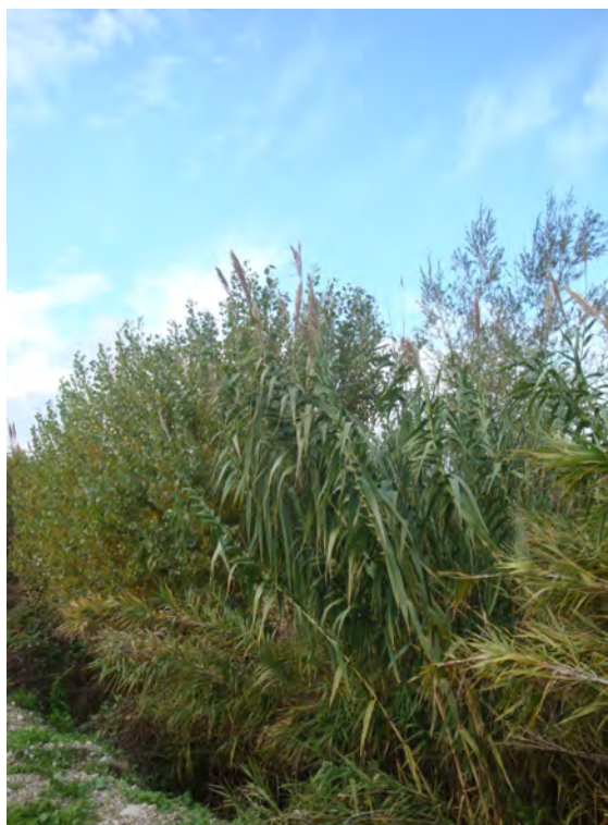
Pioppi neri e salici arbustivi radicati al margine del popolamento a canna domestica