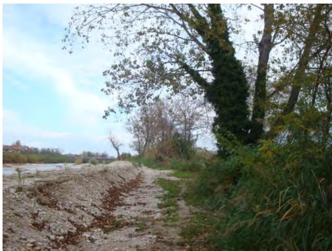
Argine privo di vegetazione; pioppo nero nell'area retrostante